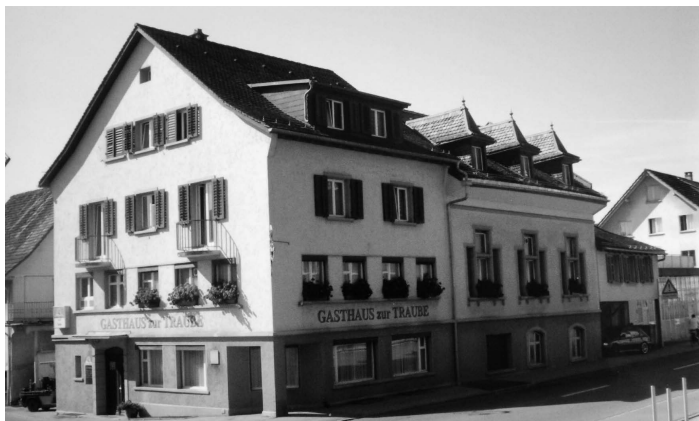
Gasthaus und Saal zur Traube. Aufnahme nach 2005.

Nach dem Kriegsende folgen Jahre mit erweitertem Arbeitsplatzangebot und steigenden Löhnen. Arbeiter und Angestellte können sich hin und wieder ein Vergnügen leisten. Zur (religiösen) Feierzeit kommen arbeitsfreie Zeitfenster. Erste Fernsehsendungen werden ausgestrahlt. Transistorradios, Plattenspieler und Tonbandgeräte beeinflussen den Lebens- und Konsumstil vor allem der Jugendlichen. Die Gestaltung der Freizeit wird zum ideellen und kommerziellen Thema. Kirchen, Vereine und Wirtschaften passen ihre Angebote den neuen Perspektiven an.