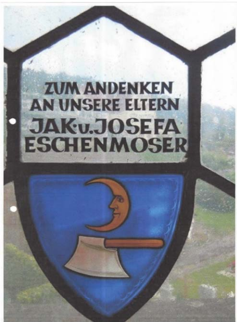
Abb. 1: Inschrift in einem der Glasfenster der Katholischen Kirche Balgach

Nachfahren einer Familie Eschenmoser von Balgach SG auf der Spurensuche nach ihren Ahnen