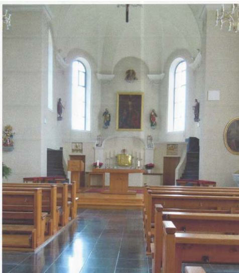
Abb. 4: Blick in die Drei-Königs- Kirche von Balgach

Der kundige Reiseführer wusste zu berichten, dass die Balgacher Gläubigen bis ins 16. Jahrhundert zur Pfarrei Marbach gehörten, was für den sonntäglichen Kirchenbesuch einen weiten Weg bedeutete. Erst 1521 wurde nach vieljährigen Bemühungen das Ziel einer eigenen Pfarrei erreicht. Danach folgten im 16. Jahrhundert die Reformationswirren. Erst 1825 bis 1826 konnte die heutige Barockkirche nach Plänen des Simon Moosbrugger aus der berühmten Architektenfamilie vom Bregenzerwald in Fronarbeit errichtet werden. 1952 bis 1953 wurde das Gotteshaus einer umfassenden Renovation unterzogen, in deren Verlauf auch neue, mit