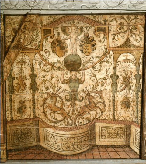
Abb. 3: 1596 liess Junker David Zollikofer im Dachgeschoss einen Festsaal mit Illusionsmalereien der Renaissance einrichten.

Das alte Rathaus war für die Spurensucher die erste Station auf ihrer Rundfahrt durch Balgach. Über die Bedeutung dieses gediegen renovierten Gebäudes hatten sie sich schon vor dem Start zu ihrer Reise in die Ostschweiz auf der Homepage der Gemeinde Balgach informiert: „Das hochaufragende massiv gemauerte Gebäude im alten Dorfteil war mittelalterliches Zehntenhaus. 1594 kaufte es der St. Galler Tuchhandelsherr David Zollikofer. Das oberste Stockwerk liess er 1596 zu einem prächtigen Festsaal mit einmaliger Aussicht ausgestalten. Die grotesken Illusionsmalereien an den Bohlenwänden sind nahezu vollständig erhalten, einzigartig in der Schweiz und somit ein Kulturgut von nationaler Bedeutung. 1969 wurde das Gebäude restauriert, unter Denkmalschutz gestellt und der Öffentlichkeit zugänglich gemacht“. Wie das Gebäude heute dasteht und als Ortsmuseum Besuchern Einblick sowohl in Balgach's Geschichte, als auch in die Lebensumstände früherer Bewohner des Rheintals vermittelt, hat die Besucher vom Zürichsee beeindruckt. Einer der Besucher hatte noch einen ganz besonderen Grund, sich zu wundern und zu freuen: Sein Grossvater mütterlicherseits war nämlich in den Jahren 1896 – 1903 Eigentümer des uralten Hauses gewesen, das seit 1894 nicht mehr zu Amtszwecken, sondern nur noch als Wohnstätte verwendet wurde. Es ist deshalb zu vermuten, dass des besagten Besucher's Mutter, Johanna Eschenmoser-Oesch (1894 – 1978), einen Teil ihrer frühesten Jugend in diesem Haus verbracht hatte.